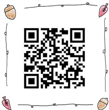
⑤ 子どもたちが好きなあそびを 教えてください！