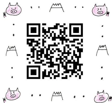
① 鹿兒島集會に参加される 皆さまに聞いてみました！