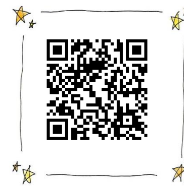
⑧速報等はこちら！！ 鹿兒島集會インスタ QR