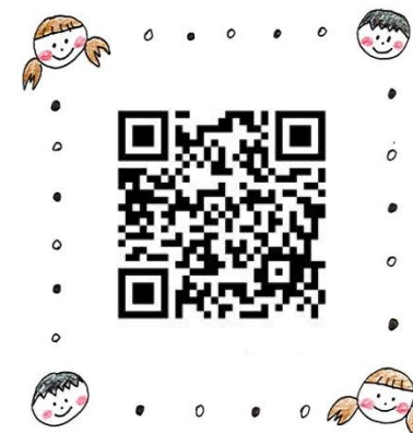
④現在の保育制度に 一言いいたい！！！！