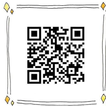
⑦ 私の園の「ここが自慢！」を 語っちゃってください！！