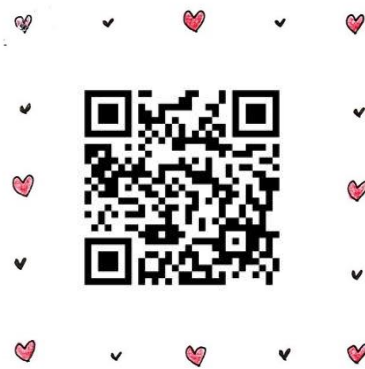
⑥ うちの園の子の かわいい&面白いエピソード