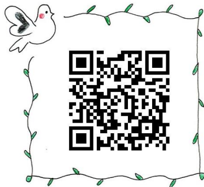
② 記念講演・講座の感想を お聞かせください！